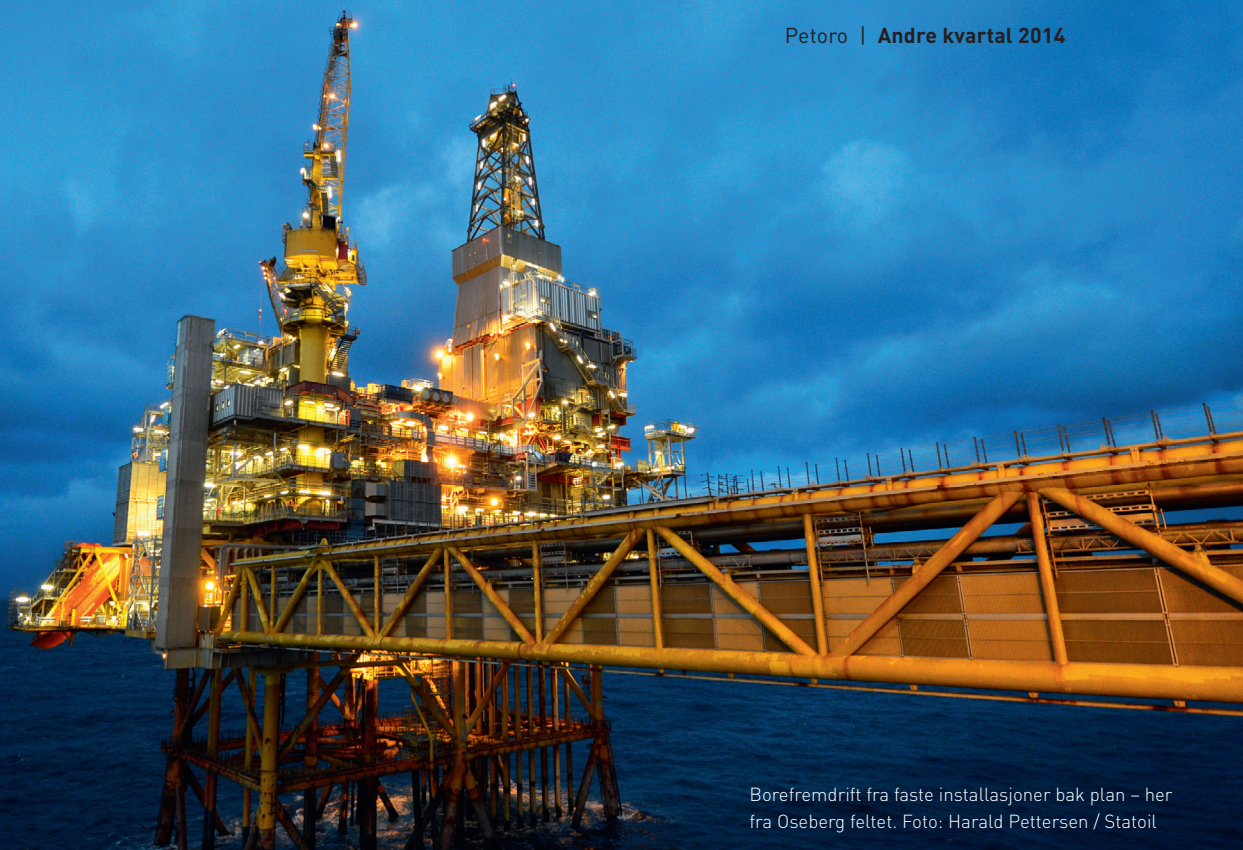
Borefremdrift fra faste installasjoner bak plan – her fra Oseberg feltet.